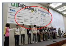
1-2)競技コース上、コース側面